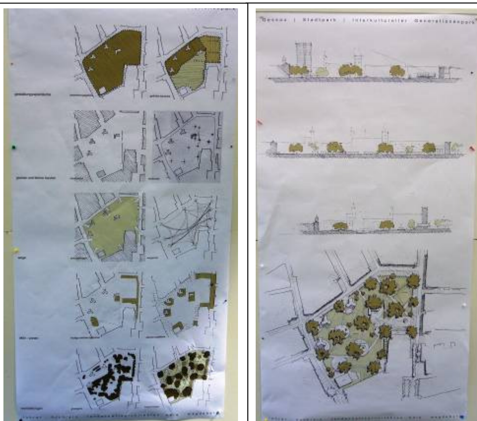
Entwürfe lohrer.hochrein, Analyse und Konzept

Das vom Büro lohrer.hochrein vorgestellte Konzept bezieht sich auf die landschaftlichen und einmaligen Qualitäten des Gartenreichs Dessau Wörlitz. Diese sollen nicht nur außerhalb der Stadt, sondern auch mitten in der Stadt zu erleben sein. Die vorhandene Substanz des Stadtparks bildet das Potenzial für dieses Konzept.